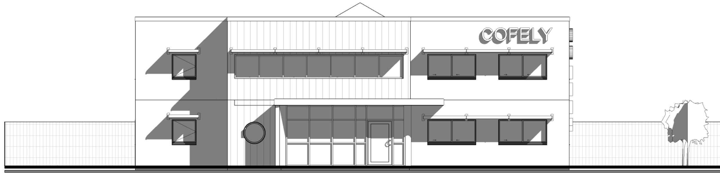
1 Elévation Sud Ech : 1 : 100